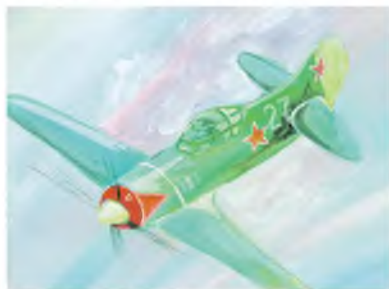
Воздушный бой. Риснок Дмитрия Нозикова (Короновская школа им. Д. Кромского)