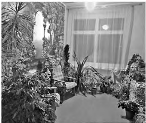
Зимний сад в Восточной школе

Большую часть дня дети проводят в школе, поэтому там решили устроить помещение значительными стенами. Так появился проект «Зимний сад в школе», способствующий художественно-эстетической организации интерьера, а ещё он адаптирует среду, оказывает положительное психофизиологическое действие на учащихся, даёт возможность оторваться от физических и нервных нагрузок.