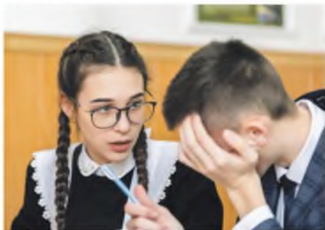
Урок обществознания в 10-м «Б» классе