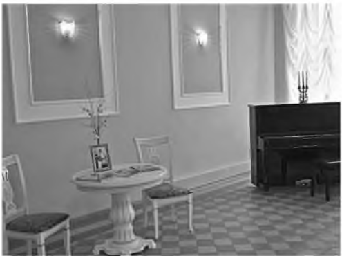
Открытый зал школы № 1