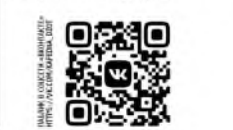
НАША СЕТЬ В СОЦСЕТЯХ: https://vk.com/kafedra_dpo

Созданные учителя в соцсети подтемы реализации физкультуры специально обученными лучшими практиками, добиться успеха регионов, конкурсных образовательных учреждений.