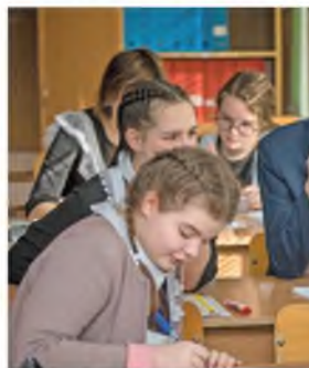
Урок обществознания в 10-м «Б» классе

Ольга МУШТАЕВА * ТЕКСТ НАДЕЖДА КОЗЛОВА * ФОТО