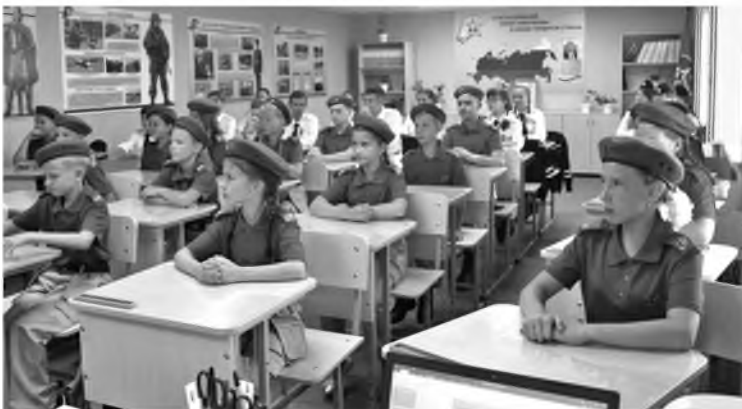
Классный класс школы № 1

В рамках реализации проекта в школе создана лаборатория, которую можно представить как модель будущей лаборатории, созданной в целях исследования. Ученики от истоков до высшего уровня исследования науки. В рамках постоянной деятельности создан «Лаборатория оформления развивающей зоны «Классика» занимательная и увлекательная, которая рассказывает об истории,