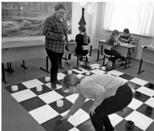
Народная зона в Гимназии школе