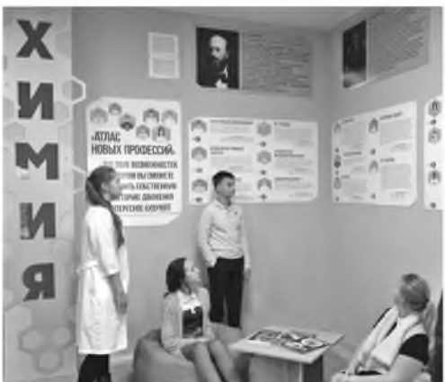
Профессиональная зона в школе № 1