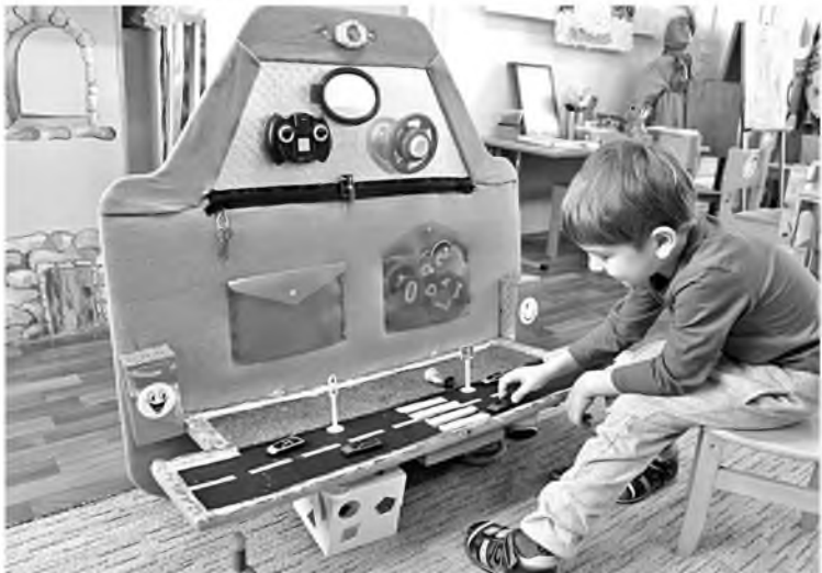
Народная зона в Детском саду № 6

Сегодня своим опытом делятся учреждения образования Новооскольского городского округа