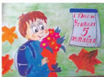
С ДНЁМ УЧИТЕЛЯ! Рисунки Валерыи Швацкой (Пятишанская школа Высокотского района)