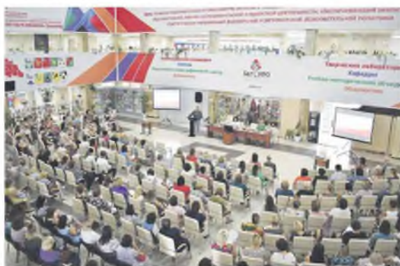
Семинарский, методический и психологический окладный центр непрерывного образования