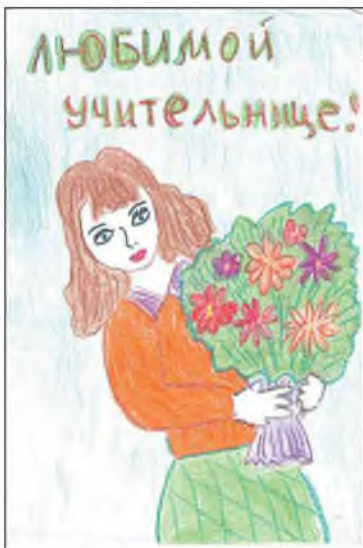
С БЛАГОДАРНОСТЬЮ! Рисунки Рязанов Сабитова (Высокотская школа Старокальского городского округа)

Учить детей — дело необходимое, следует понять, что весьма полезно и нам самим учиться у детей.