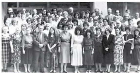
Коллектив Белгородского областного института усовершенствования учителей, 1954 год

Благодаря профессионализму, преданности своему делу, большому трудолюбию, таланту преподавателей, педагогов институт развивался, успешно выполняя свою главную миссию — повышать качество образования Белгородской области. Сегодня наш институт обладает высоким потенциалом, компетентным и работоспособным профессорско-преподавательским составом, который полон творческих планов и замыслов. Надеемся, что всё это позволит нам эффективно реализовывать как региональные, так и федеральные инициативы. Желаю всем преподавателям и сотрудникам Белгородского института развития образования радости, профессиональных побед, счастья и любви близких, душевного равновесия, интересного и плодотворного учебного года!