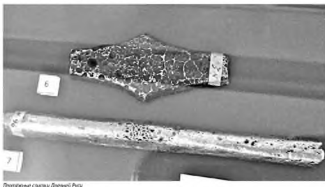
Плетёные слитки Древней Руси

В Белгороде экспонируется уникальная выставка, посвящённая истории России