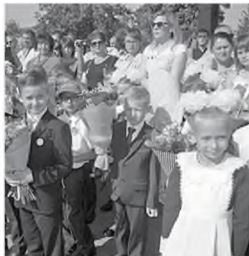
ФОТО ОБЩАЯШКОЛЫ № 13 г. БЕЛГОРА

Работа с детьми, конечно, закончается, прежде всего, в качественном получении знаний, в развитии всех талантов и моральных принципов, в воспитании человека (в широком смысле понимая). Я могу уверенно сказать, что те дети, которые ходят, получают в этой школе все знания и даже ещё немного больше. Об этом го-